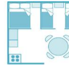
BUNGALOW TOILEE AVEC 2 CHAMBRES TOILEES 5 Pers (une avec un lit 140+ une avec trois lits 90 dont un superposé)