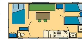
MOBIL HOME 5/6 PERSONNES AVEC 2 CHAMBRES (une avec un lit 140+ une avec 2 lits 90) + CANAPE CONVERTIBLE DANS LE SALON ~ 4m x 8m