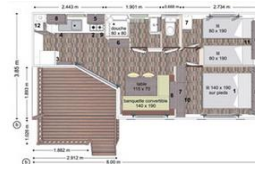
MOBIL HOME 2011 4 PERSONNES AVEC 2 CHAMBRES (une avec un lit 140 + une avec 2 lits 90) ~ 4m x 8m